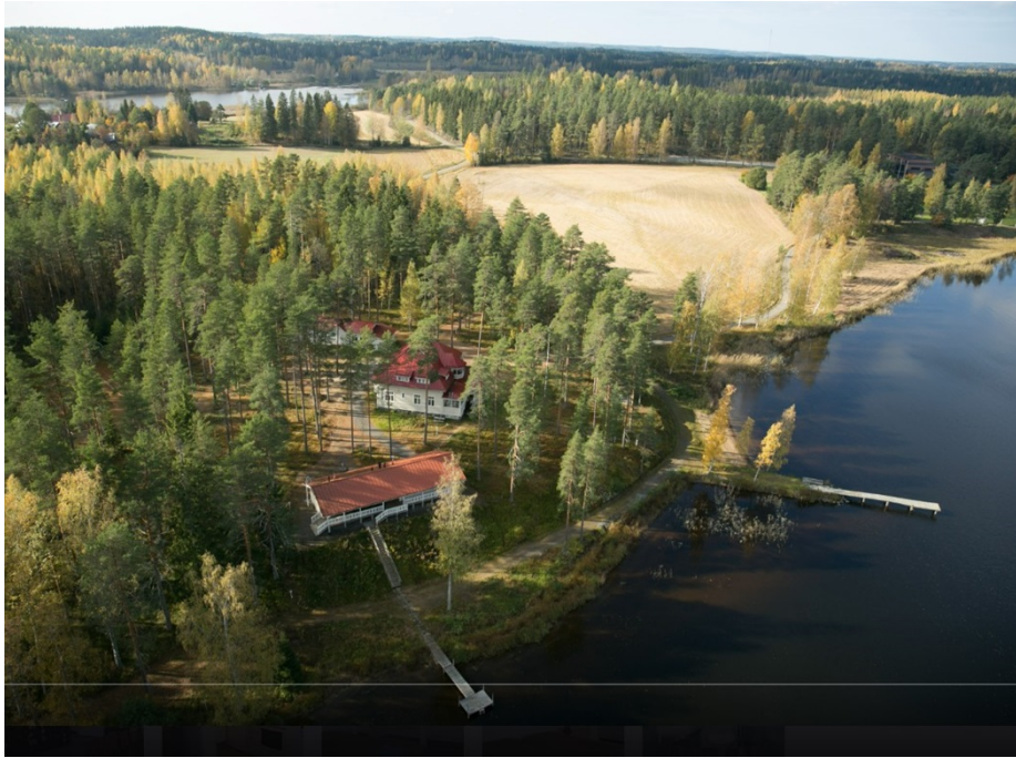
Aurala ja maisemallisesti arvokas peltoalue.